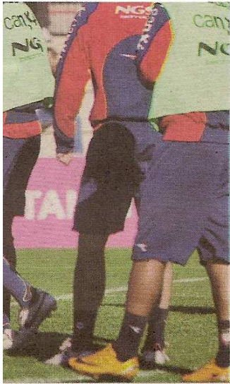
...illo de Osasuna en Tajonar.